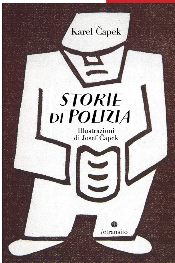
Disegni di Josef Capek

Scrittore, giornalista, disegnatore e anche giardiniere, Karel Capek (1890-1938) è stato un'importante figura letteraria nell'Europa della prima metà del XX secolo.